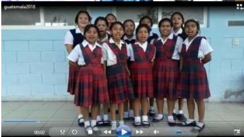
Video Casa - Hogar "Nuestra Señora de los Remedios"